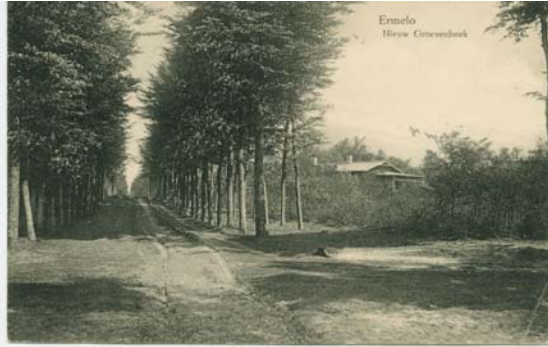
Nieuw Groevenbeek 1925