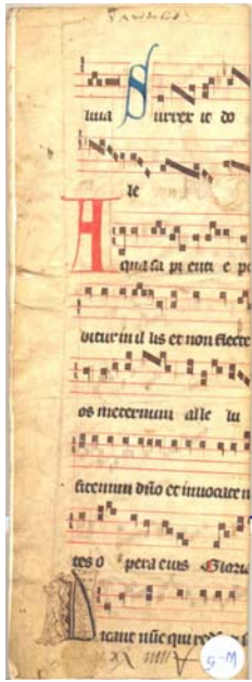
Bindmateriaal met fragmenten van Karolingische handschriften

waarschijnlijk ooit als 'oud papier' verkocht zijn door de lokale kloosters.